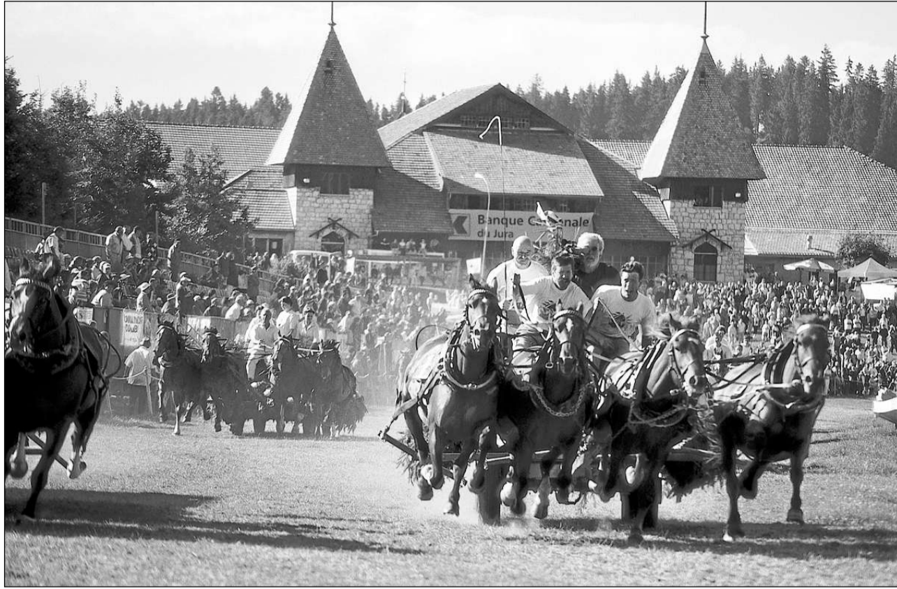
Las cursas da chavals a Saignelégier èn adina in spitachel per ils aspectaturs.

Geograficain en il chantun Giura ed ils dus chantuns envidads fitg distants. La devisa duai exprimer tge ch'è ina chaussa cuminaivla dals trais chantuns e tge ch'è impurtant per els: en il Grischun ed en il Glaruna las muntognas che caracteriseschan la cuntrada ed il turissem ed en il Giura las Francas Muntognas che dattan er la temprà a la cuntrada e ch'èn enconuschentas per la tratga dals chavals freiberger. Il Marché-Concours è in'ocasiun bainvegna per tgirar contacts amicabels.